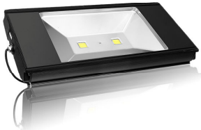
PRO VG 10: 80 / 100 / 120 och 140 watt