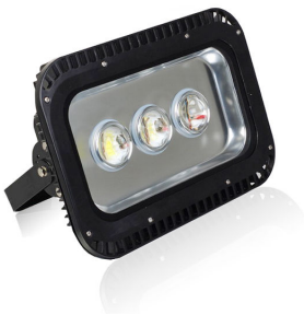
PRO VG 8: 120 och 150 watt

MOVAB Maskin & Verktyg AB Järnvägsgatan 22 533 30 Götene Sweden