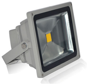
PRO VG 1: 10/30 och 50 watt