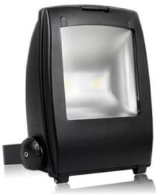
PRO VG 3: 80 och 100 watt