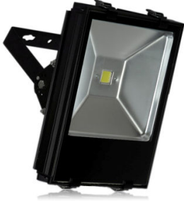
PRO VG 9: 50 och 70 watt