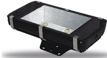
PRO VG 13: 100 / 120 / 140 och 160 watt