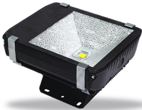
PRO VG 12: 60 och 80 watt