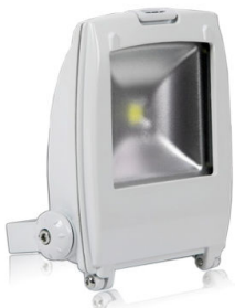
PRO VG 2: 10/20/30/50 och 70 watt