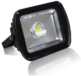
PRO VG 6: 50 och 60 watt