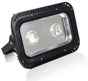
PRO VG 7: 80 / 100 / 120 och 140 watt