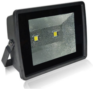
PRO VG 11: 160 / 180 och 200 watt