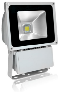
PRO VG 4: 60 och 80 watt

MOVAB Maskin & Verktyg AB Järnvägsgatan 22 533 30 Götene Sweden