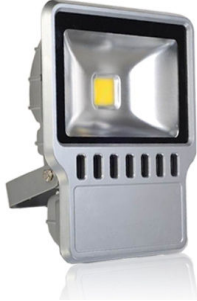
PRO VG 5: 100 och 120 watt